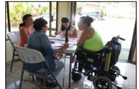
Programa adaptado a las medidas COVID-19

Cualquier medio que requiera la adaptación de la mujeres participantes.